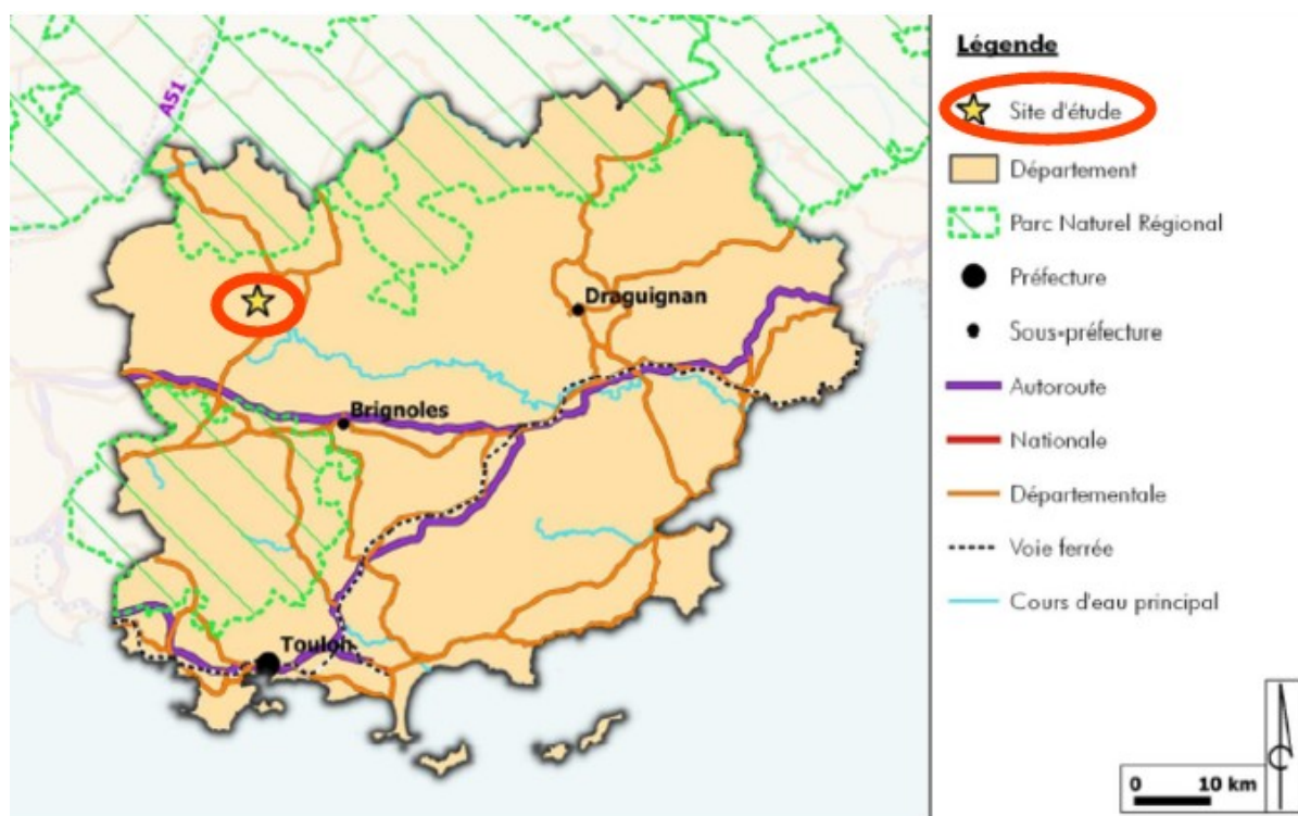
Figure 1 : Localisation du site à l'échelle du département

La commune de Barjols se situe dans le département du Var, à 20 km au nord de Brignoles. Territoire présentant un caractère rural affirmé, Barjols compte une population de 3 017 habitants (recensement INSEE 2020) sur une superficie de 30 km 2 .